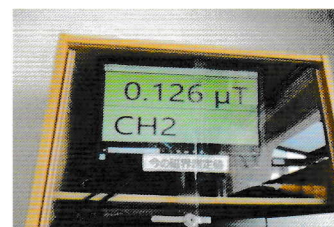
'21年4月15日9時43分の測定

自治会館の入り口に入ってすぐの右上の壁に、磁界測定器を設置しています。今までの測定値は最大0.29マイクロテスラでした。(国の定める規制値は200マイクロテスラです)。