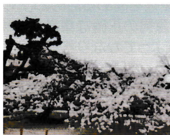
改修した天神山公園の桜(21)

このような状況を踏まえて東部建設事務所に要望書を提出し各公園の整備を進めています。景色が楽しめるように大きくなりすぎた木を一部伐採し、季節変化を感じられる花が咲く公園にしていきたいと思っています。天神山公園は昨年度に改修しました。