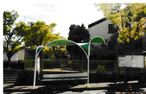
公園前バス停 後ろは御影山手第一小公園 バス停屋根・ベンチ・回覧板が完備している