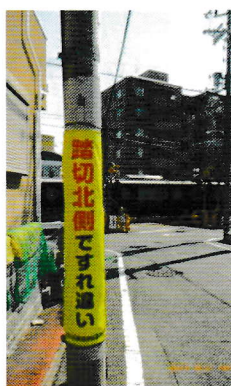
左・中の2枚 北側から撮影